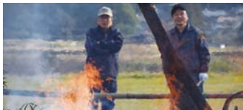
ゆらゆら揺れる炎。見飽きることがありません。