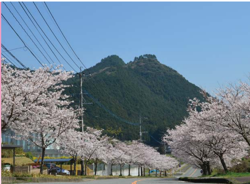
街内の桜と遠くに見える生矢が平山(しょうじがひらやま)とのコントラストは見事。

美奈宜の杜には、四季折々の美しい風景があります。街が淡い桜色に染まる春は、一年の中でもひととき美しい季節。街へと上がる坂道の桜並木は、20年の間にすくすく成長し、朝倉市内の中でも桜の名所といわれるほどになりました。ほかに街内には桜の木々が点在し、そこかしこに春を感じる事ができます。もちろん、朝倉にはそのほかにもたくさん桜の名所が。筑前の小京都・秋月、寺内ダム公園、甘木公園、夕月神社…。春を彩る、美しい桜の風景を巡ってみませんか？