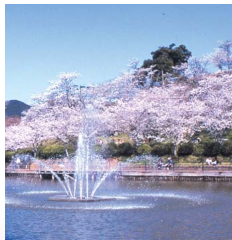
桜と憩い 甘木公園 美奈宜の杜から車で約15分