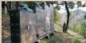
木立の中にたたくむ漏刻の模型。