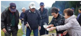
炭で焼き上げたお餅を入れたせんざいは最高!