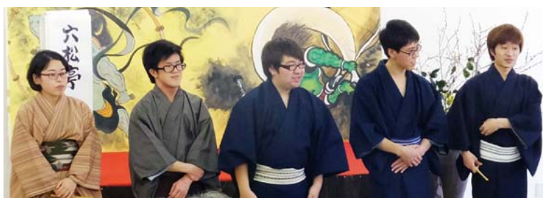
九州大学落研の噺家の皆さん。

これまで九州大学、福岡大学、九州教育大学、そして3大学合同と、毎年新鮮な顔ぶれで開催されてきましたが、今年是最初に戻って九州大学の落語研究会による寄席が開催されました。 前週は大雪だった天候も回復した当日。会場には、毎年この出前寄席を楽しむにしている60名以上の住民の皆さんが来場されました。 「竹和」「春菊」と個性的。「かぼちや屋」「後生鰻」などの演目を披露し、会場を明るい笑いで包み込みました。