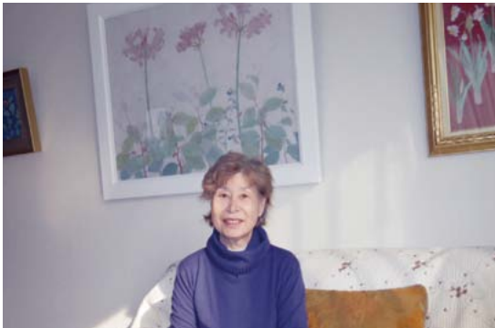
白が基調の30号の大作は8年前、美奈宜の杜の新居に合わせて制作した作品。