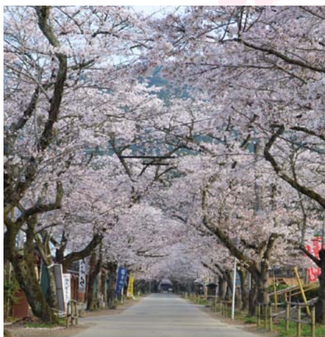
桜のトンネルに目を奪われる 秋月 杉の馬場 美奈宜の杜から車で約10分