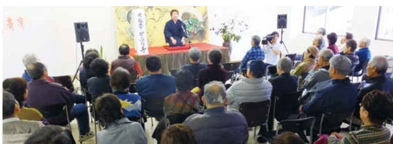
つかみの話から、会場は笑いの渦に。