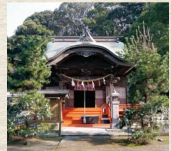
現在の本殿は1772年の改築。

地域の人々と共に伝えられてきた祭事も多く、粥のカビの状態で農作物の吉凶を占う3月の「粥占い祭」、