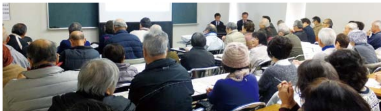
文化教室はたくさんの方々に。

今年1月から運用が開始されたマイナンバー制度は、国民の情報を正確に把握し、行政の効率化・国民の利便性向上、公平公正な社会の実現を行うための仕組みです。当日は、個人番号カードと通知カードの説明から始まり、制度に対する安心安全の確保、注意したい点など、多岐にわたっての話がありました。 最後の質疑応答では、個人情報管理の方法、暗証番号・カードリーダーなどセキュリティの問題やマイナンバーカードの利用方法などたくさん質問があり、皆さんの関心の高さがうかがえる出前講座になりました。