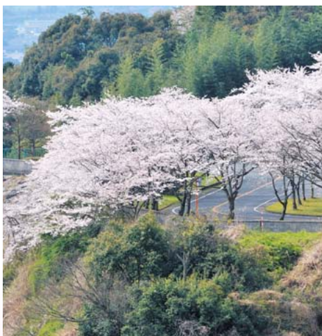
ダム湖と桜のコントラスト 寺内ダム公園 美奈宜の杜から車で約5分