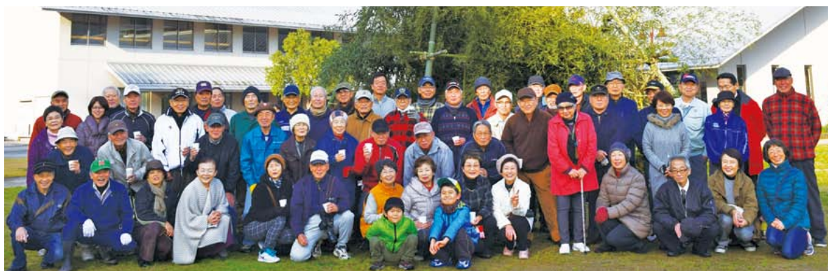
記念の集合写真。よき一年でありますように。

炎は人の心を和ませるのか、火の勢いが弱まった後も櫓を囲みながら、いつまでも談笑する住民の方々の姿が見られました。