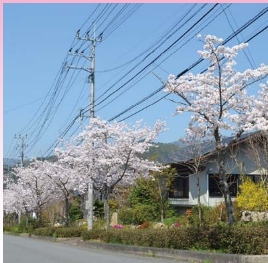
街へと続く坂道の桜は、まるで青空へと昇る花の階段のようです。