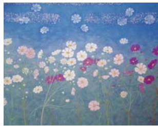
新しい作品も製作中。